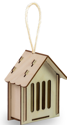
Insekten-Häuschen / insect house

Bilder und Schriften müssen eingebettet werden. Images and writings must be embedded.